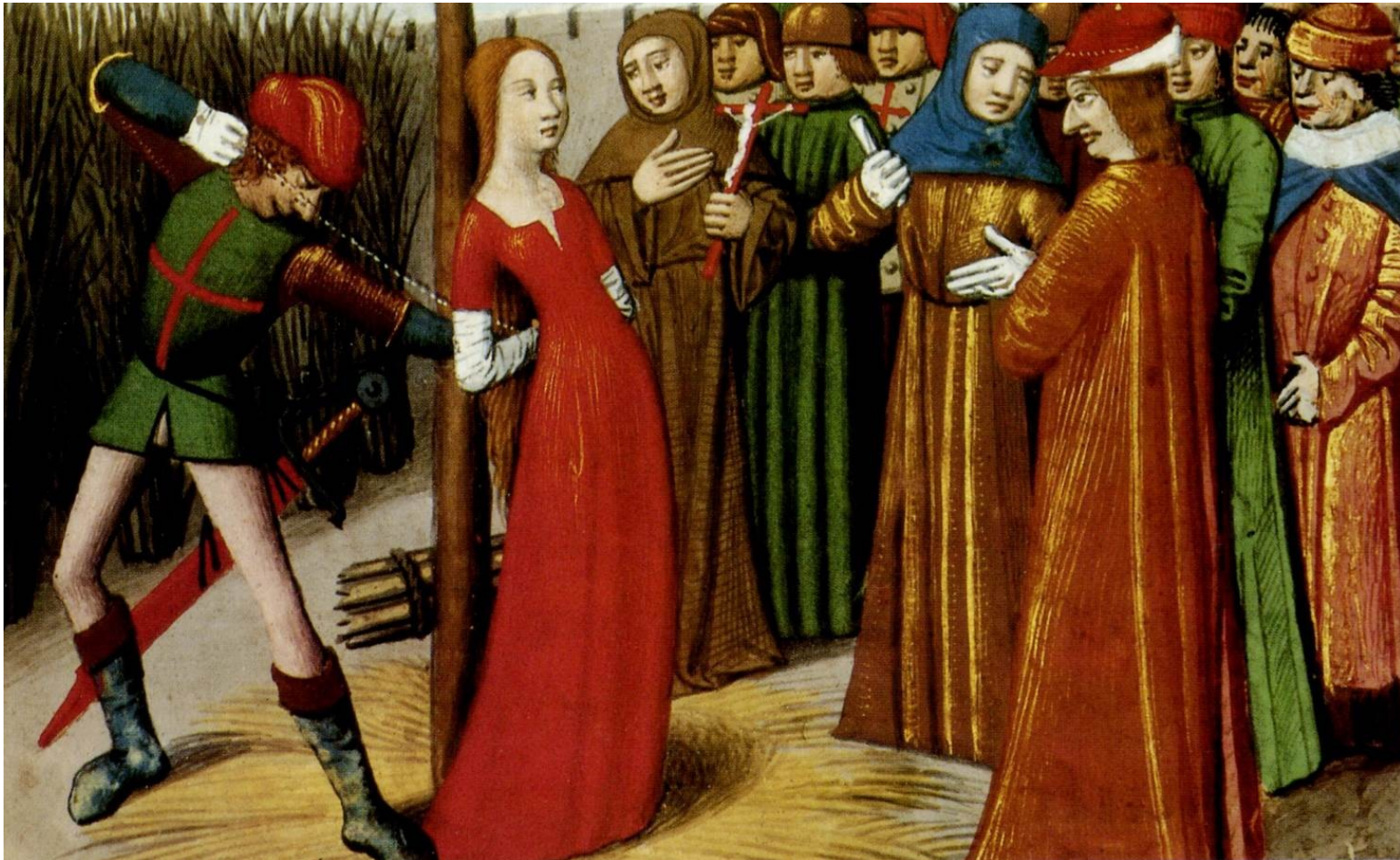
Jeanne d'Arc au bûcher, miniature extraite des Vigiles de Charles VII de Martial d'Auvergne, Paris, BnF, fin du XV ème siècle. (Note : on ne cuit pas le condamné sur le bûcher mais dans le bûcher, d'où le poteau scellé dans le sol et le tas de bois à côté)

Une illuminée victime trois fois du marketing politique : celui de Charles VII, des Républicains fin XIXème et des nationalistes europhobes aujourd'hui.