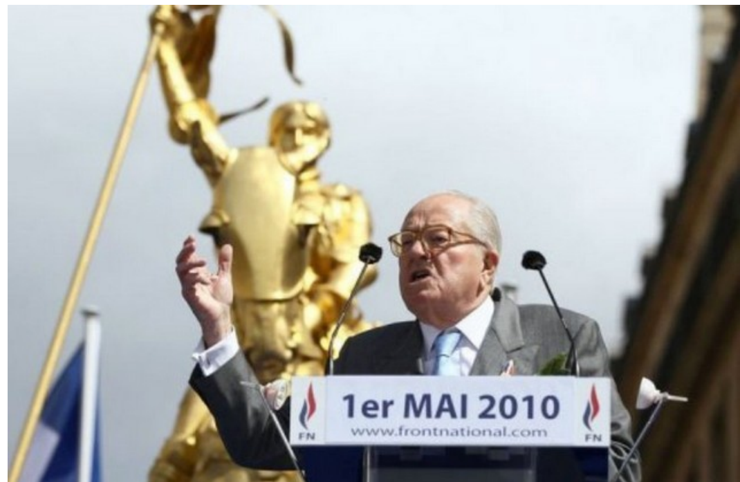
Le président du Front National Jean-Marie Le Pen lors traditionnel hommage à Jeanne d'Arc, le 1er mai à Paris