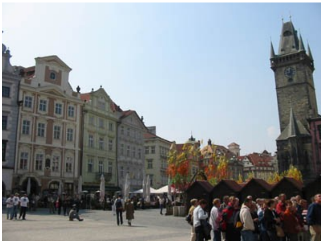
La grand'place (Slacestromestske), avec son horloge astronomique.

Et sa statue hommage à Jean Huss, fondateur de l'hérésie hussite à l'époque de la Réforme.