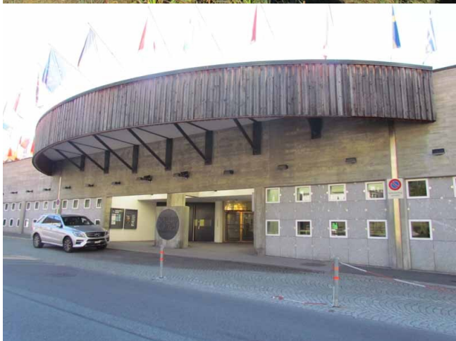
Le centre de congrès, ci-dessus, un bâtiment moderne et franchement laid.